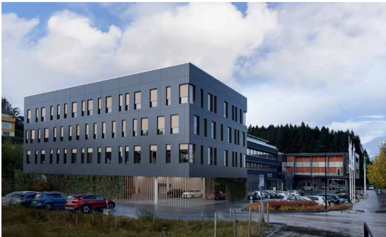
K3 av Kunnskapshuset skal stå ferdig våren 2023.