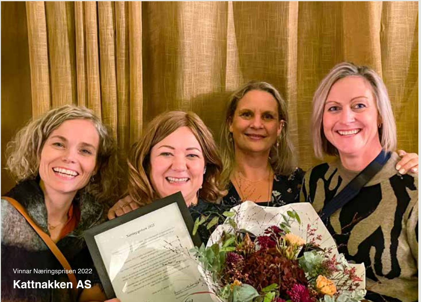
Vinnar Næringsprisen 2022 Kattnakken AS